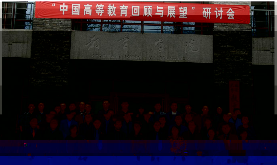
“中国高等教育回顾与展望”研讨会

第四阶段研讨的主题是,展望下一阶段高教发展的重点与对策。代表们集中地提出了五个方面的问题,分别是高校去行政化、教育资源配置公平、课程与人才培养、考试招生和录取、职业教育。之后,通过分组讨论,每个小组选